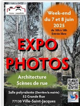
Expo photo Yapafoto