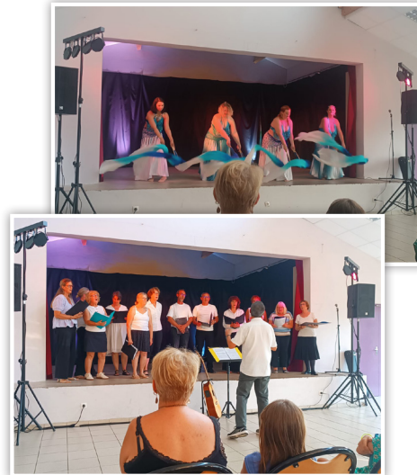
Soirée Gala des associations