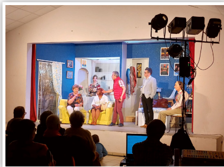
Soirée Théâtre : Un stylo dans la tête