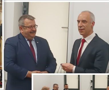
Rencontre avec le maire de Czernica