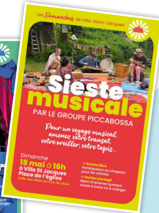
Les Dimanches de Ville-Saint-Jacques