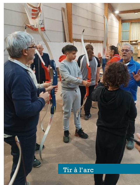
Tir à l'arc