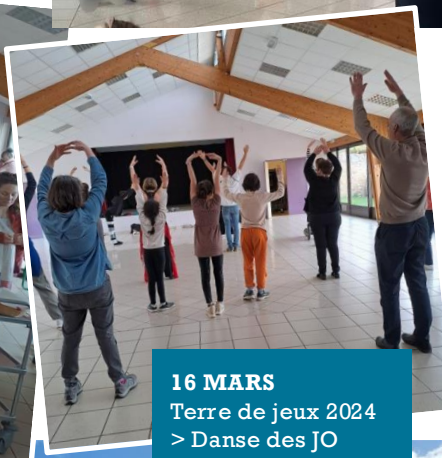
16 MARS Terre de jeux 2024 > Danse des JO