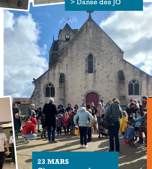
23 MARS Chasse aux œufs sur le grand marché