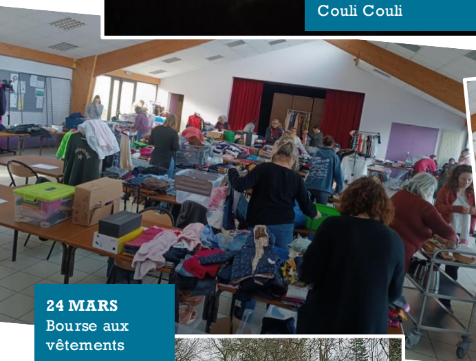
24 MARS Bourse aux vêtements