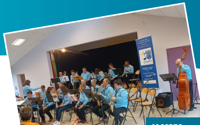
02 MARS Concert harmonie de Montereau