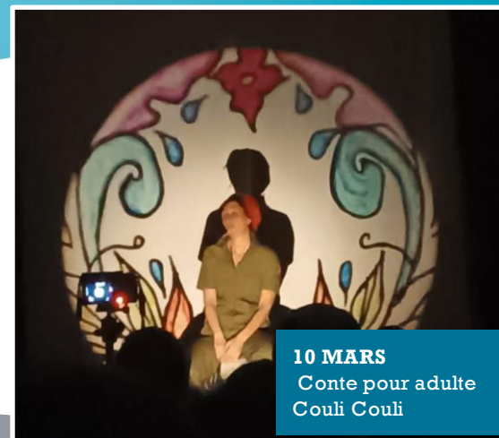
10 MARS Conte pour adulte Couli Couli