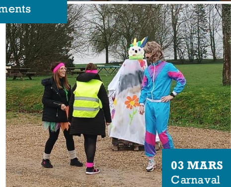
03 MARS Carnaval